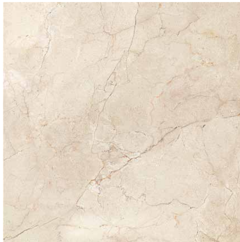
60CLM CLASSICA MARFIL 60x60 RETTIFICATO LAPPATO