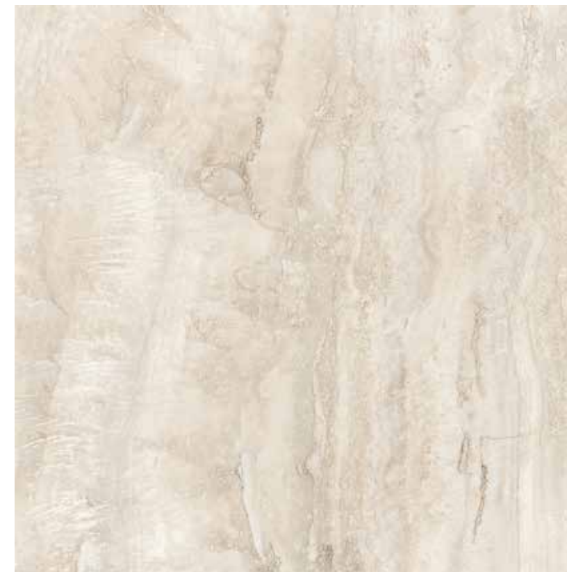
60CLT CLASSICA TRAVERTINO 60x60 RETTIFICATO LAPPATO