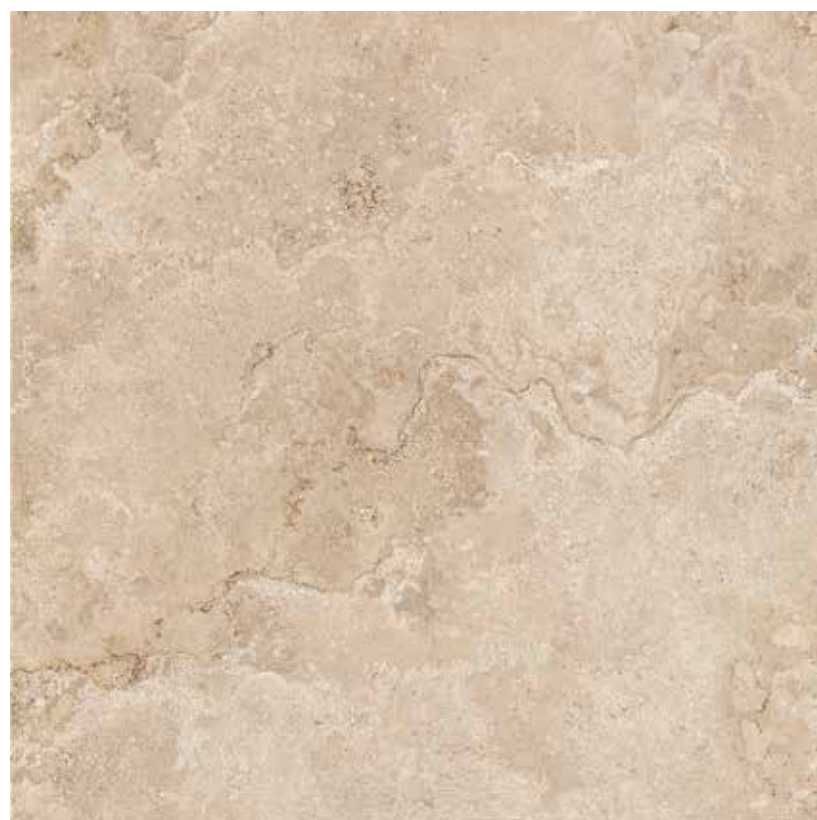
60CLRA CLASSICA RAPOLANO 60x60 RETTIFICATO LAPPATO