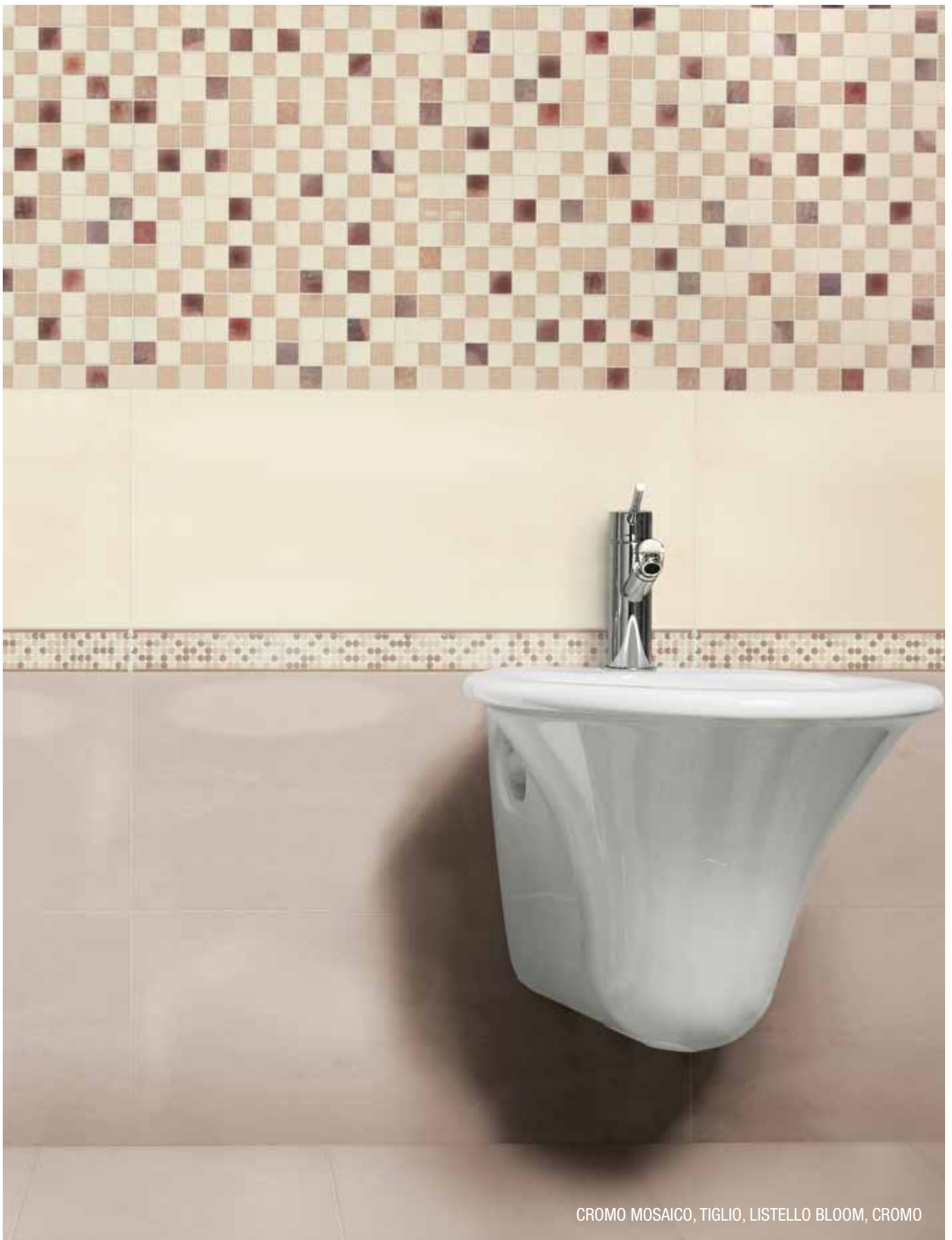
CROMO MOSAICO, TIGLIO, LISTELLO BLOOM, CROMO

SPESSORE . thickness . Stärke . épaisseur 9 MM