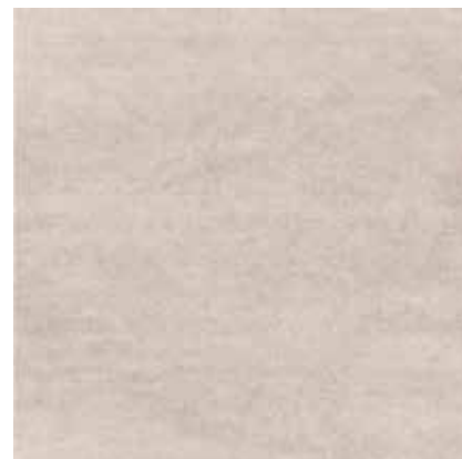
33MC CROMO 33x33